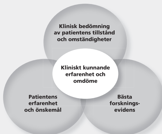
Figur 2: Modell för evidensbaserad praktik med utgångspunkt från Hayes et al (2002)

Vid bedömning av vilka effekter som ska vara målet för behandlingsinsatser är symtomminskningar centrala, men också förbättringar av funktion i olika avseenden (skola, relationer, beslutsfattande m.m.) och livskvalitet (Levant, 2006).